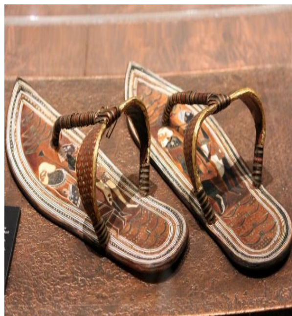
Sandále, na ktorých sú vyobrazení nepriatelia.