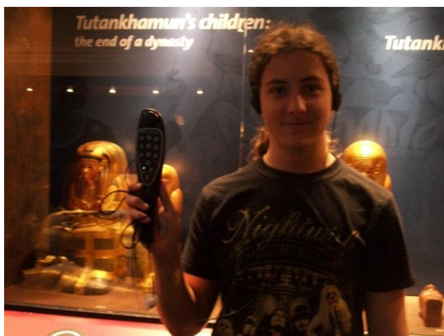
Návštevník s „diaľkovým ovládačom.“