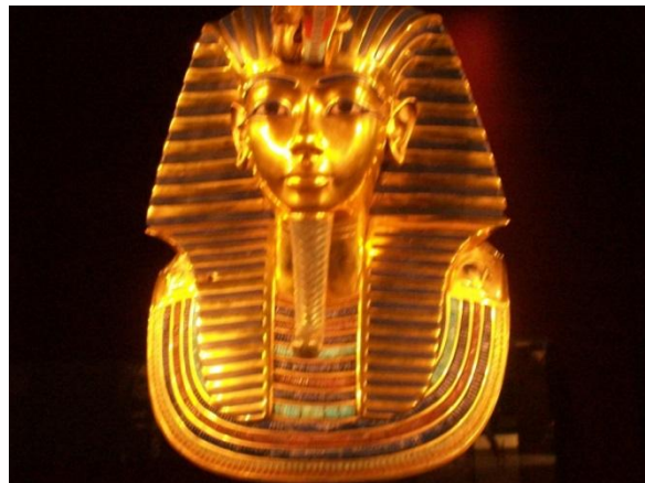
Tutanchamonova zlatá maska. Ktorá mala za úlohu zaujať návštevníkov spoločne s ďalšími exponátmi

Ani sme sa po vstupe nestihli zorientovať a už nám podávali slúchadlá a prístroj, ktorý pripomínal diaľkový ovládač. Tento prístroj, ako sme neskôr zistili, sa používa ako prijímač zvukového signálu. Počas výstavy sme si mohli podľa vlastnej vôle vypočuť viac ako dva tucty zvukových stôp, ktoré obsahovali poučné informácie o Tutanchamonovi. Vošli sme do prvej výstavnej miestnosti a uvideli kamennú dosku, do ktorej bol vyrytý nápis v prastarom egyptskom jazyku. Tu sme si na našich prístrojoch mohli vypočuť informácie o tomto významnom náleze. V miestnosti si žiadali pozornosť aj staré mapy a plagáty so základnými informáciami o Egypte. Táto miestnosť nebola pre priaznivcov starých predmetov ako som ja zaujímavá, lebo tu boli plagáty plné textu. Po niekoľkých minútach sme sa presunuli do tmavej miestnosti s premietacím plátnom a stoličkami.