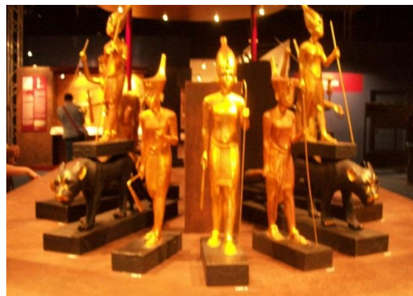
Zlaté sošky nájdené v Tutanchamonovej hrobke